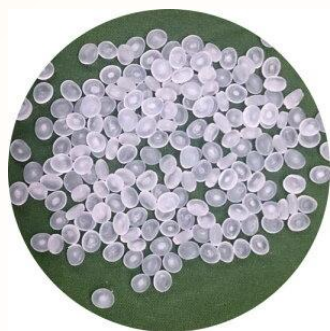
ペレット粒状 (ぬいぐるみ作り用)