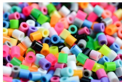
アイロンビーズ (色は何でもOK)